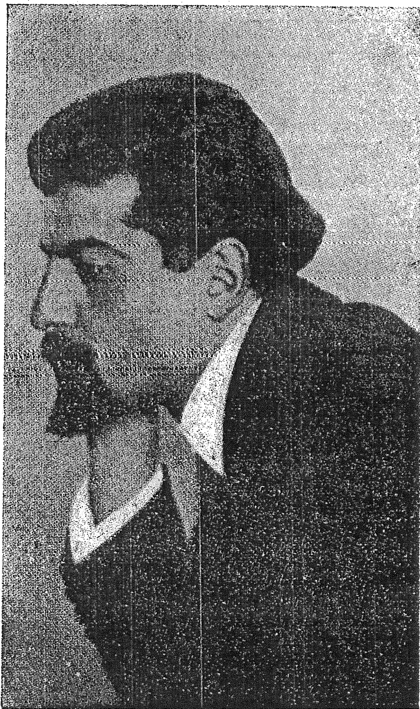
ՌՈՒԲԵՆ ՍԵՒԱԿ (Ռուբեն Չիլենկիրեան)