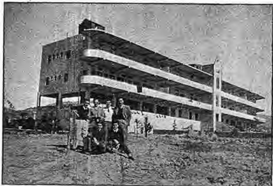
Ագու յիւէի Ազգային Թոնախաւարու ծարանը

Որբուհիի մը հետ ամուսնացեր, երեք զաւակներ ունեցեր էր. խեղճերը թոչունի ձագերու պէս կը բանային իրենց բերանը՝ ու հիմա չոր հաց մը կը պահուէր իրենց շուրթին... : Հասցա եթէ այդ մայրական այծերն ալ չըլլային, ո՞վ պիտի սնուցանէր թէ՛ հայրը, թէ՛ զաւակներ